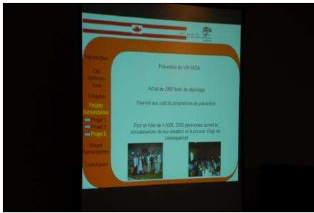
Notre présentation PowerPoint!

Merci à Mr. Mario Baril, notre photographe professionnel bénévole pour la soirée!