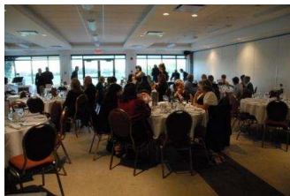
Notre salle au Four Points by Sheraton de Charlesbourg